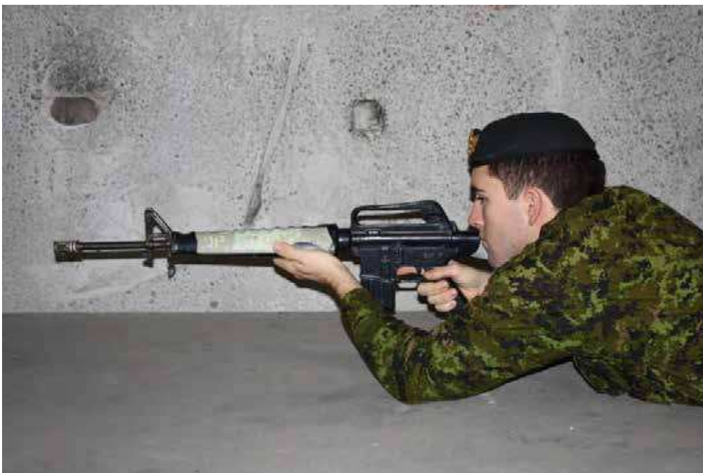
Figure 5 Tenir le fusil C7 dans la position couchée (vue du côté droit)

Nota. Créé par le Directeur - Cadets 3, 2008, Ottawa, ON, Ministère de la Défense nationale.