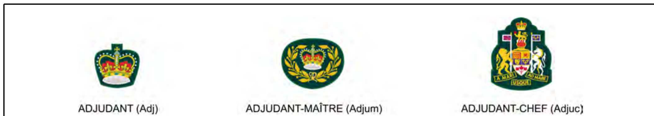
Figure 2 Militaires du rang : adj – adjum – adjuc

Ces grades sont portés au bas de la manche du bras droit sur la veste d'uniforme du cadet.