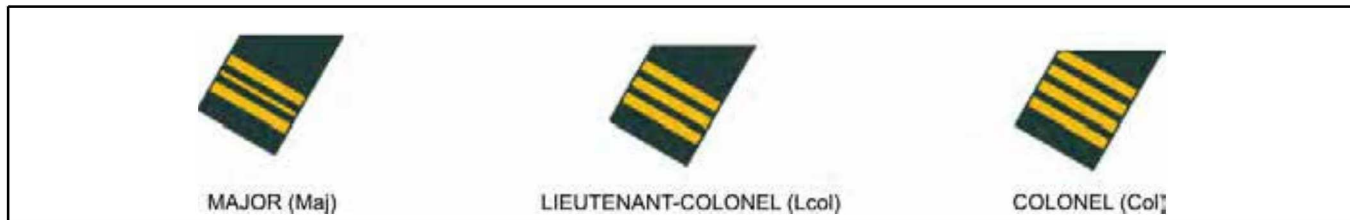
Figure 4 Officiers supérieurs