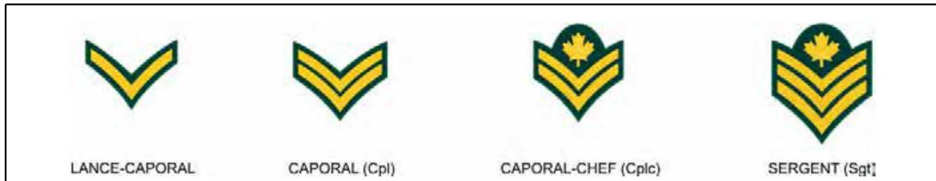
Figure 1 Militaires du rang : lcpl – cpl – cplc – sgt

Ces chevrons sont portés sur la partie supérieure du bras, sur la manche droite de la veste d'uniforme du cadet.