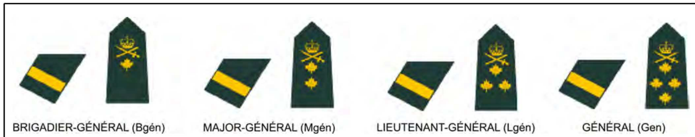
Figure 5 Officiers généraux

Les officiers généraux portent une large bande en or sur la manche de la veste d'uniforme. Sur leurs épaules, ils portent des pattes d'épaule amovibles ou des épaulettes rigides avec une couronne « Tudor » au-dessus d'épées croisées et d'un bâton qui, à cet effet, ont des feuilles d'érable au bas. Plus il y a de feuilles d'érable, plus le grade est élevé.