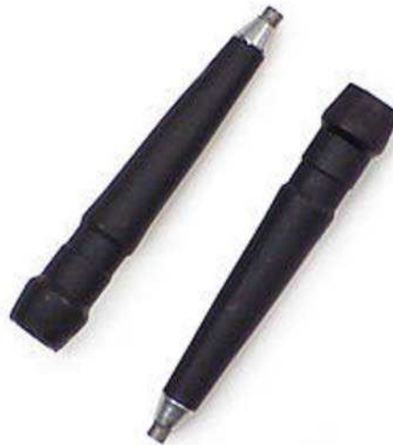
Figure 8 Pointes remplaçables

GoSki-Real Resort Info. 2005. Poles and Trekking Poles. Extrait le 17 avril 2007 du site http://www.goski.com/gear/product/LifeLink_Replaceable_Flex_Tip_Pair.html