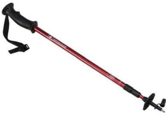
Figure 2 Bâton de marche télescopique

Black Diamond. 2005. Gear. Extrait le 12 avril 2007 du site http://www.bdel.com/gear/fixed_length_ski.php