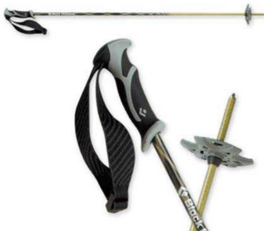
Figure 1 Bâton de ski

Les bâtons de ski et de marche peuvent être utilisés pour de longues marches et des randonnées en montagne faciles sur des surfaces au sol de même niveau. Les bâtons de marche peuvent être un choix acceptable pour des randonnées en montagne modérées. Les bâtons de marche télescopiques sont le choix le plus polyvalent. Ils travaillent bien pour la randonnée pédestre ou en montagne sur un terrain à géographie différente.