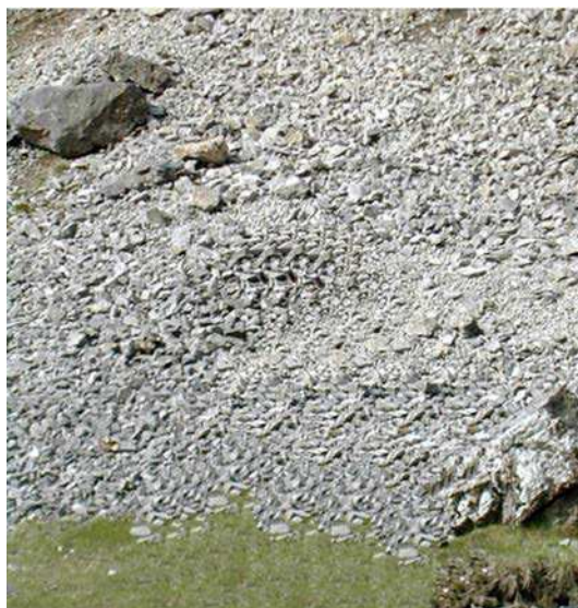
Figure 13 Éboulis

Un éboulis est un amas de petites roches que l'on trouve souvent au-delà de la limite des arbres sur les pentes de montagnes. Lorsqu'on doit traverser un éboulis, la prudence est la première règle.