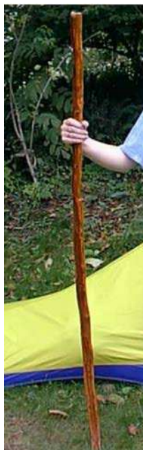
Figure 3 Bâton de marche en bois

The Walking Stick. 2005. Hiking Poles & Walking Sticks & Staffs. Extrait le 12 avril 2007 du site http://www.backpacking.net/walkstik.html