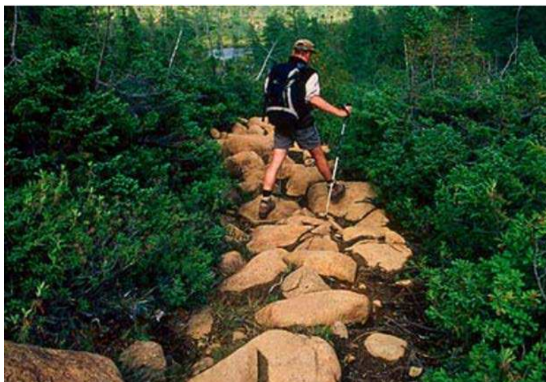
Figure 12 Sauter d'une roche à l'autre avec des bâtons de marche

Great Outdoor. 2006. Hiking the Forgotten End of the AT. Extrait le 12 avril 2007 du site http://www.greatoutdoors.com/go/photos.jsp?title=hikingtheforgottenendoftheat&imag=1