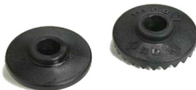
Figure 7 Paniers pleins

Backcountry Edge. 2004. LEKI Snowflake Baskets. Extrait le 17 avril 2007 du site http://www.backcountryedge.com/products/leki/snowflake_baskets.aspx