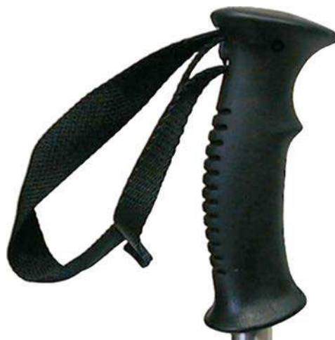
Figure 5 Poignée avec sangle

Les poignées. Les poignées qui sont formées pour s'ajuster à la main sont plus confortables à agripper et plus faciles à utiliser pendant une longue période. Les poignées qui sont rigides peuvent devenir humides avec la transpiration et être inconfortables à tenir. On doit essayer plusieurs modèles pour trouver celles qui s'ajustent le mieux à la main. Une sangle réglable doit être attachée à la poignée pour éviter d'échapper le bâton.