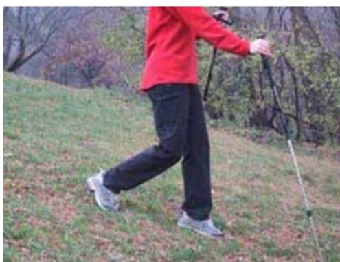
Figure 10 Descendre une pente en randonnée en montagne

Descendre une pente en randonnée en montagne. Les bâtons de marche aident à réduire le choc aux articulations chaque fois que le pied se pose au sol en descendant une pente.