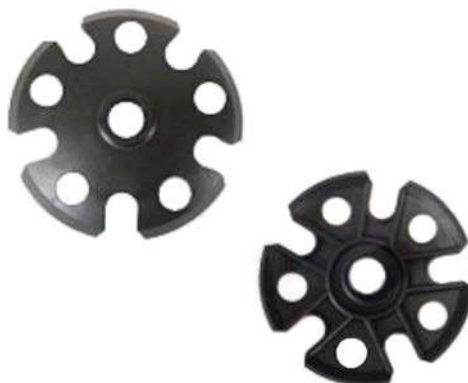
Figure 6 Paniers en forme de flocons de neige

Backcountry Edge. 2004. LEKI Snowflake Baskets. Extrait le 17 avril 2007 du site http://www.backcountryedge.com/products/leki/snowflake_baskets.aspx