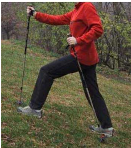
Figure 9 Monter une pente en randonnée en montagne

TrekkingPoles.com. 2006. How to Use Trekking Poles. Extrait le 26 avril 2007 du site http://www.trekkingpoles.com/custserv/custserv.jsp?pageName=How_To_Use