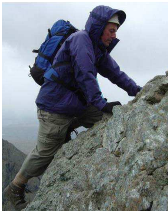
Figure 11 Techniques de grimpée

Talisman Newsletter. 2006. Merry Christmas. Extrait le 17 avril 2007 du site http://www.talisman-activities.co.uk/downloads/newsletters/newsletter4/newsletter4.htm