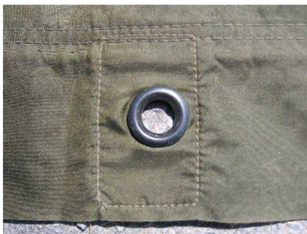
Figure 1 Œillet

D Cad 3, 2006, Ottawa ON, Ministère de la Défense nationale