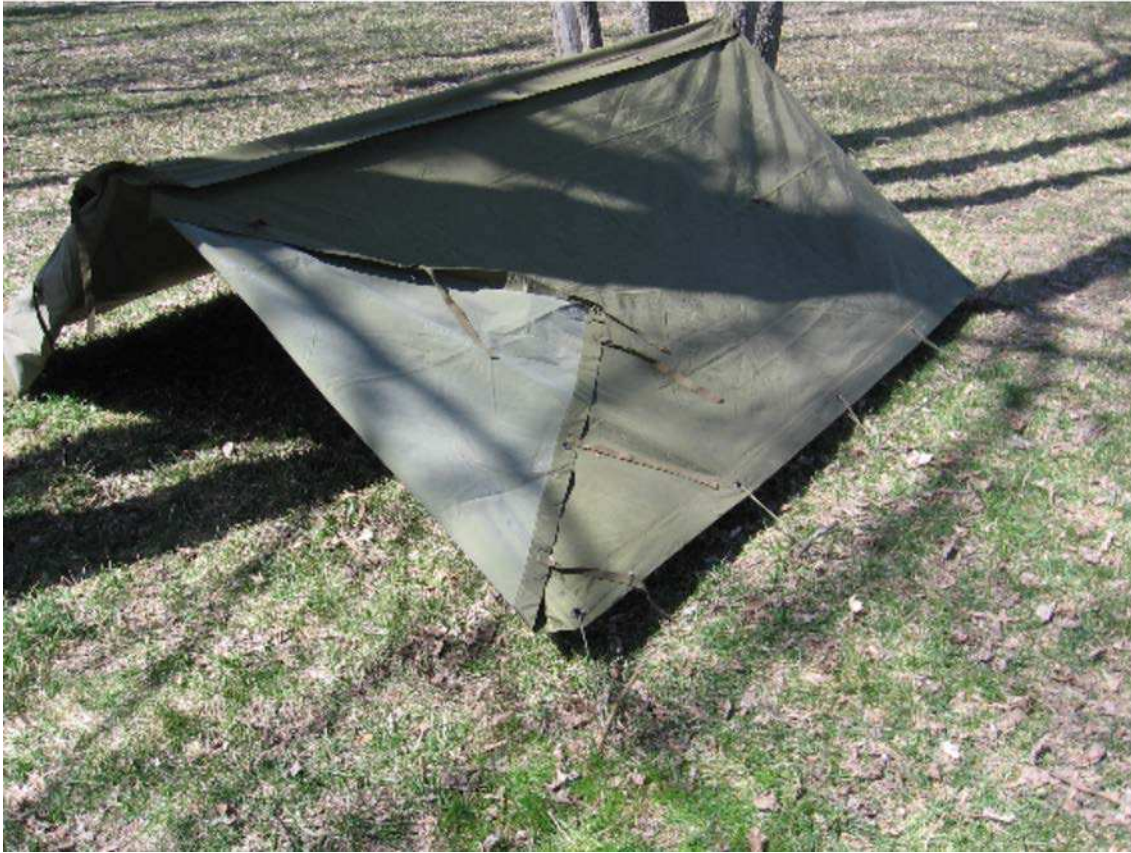
Figure 8 Tapis de sol bien tendus

D Cad 3, 2006, Ottawa ON, Ministère de la Défense nationale