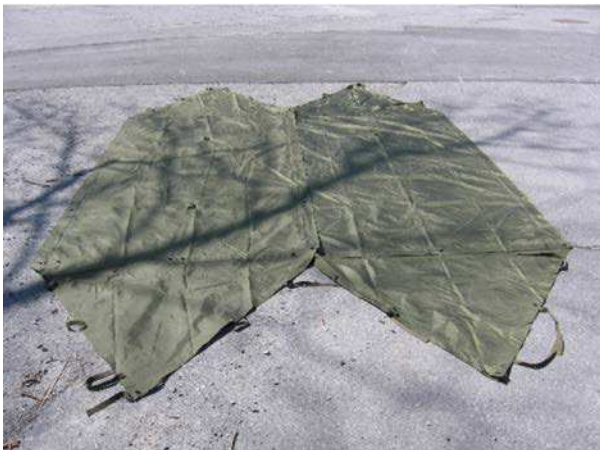
Figure 4 Les tapis de sol joints

Attacher chaque extrémité des tapis de sol attachés ensemble avec la fermeture à glissière aux deux arbres en passant la ficelle par les œillets qui se trouvent à chaque extrémité de la fermeture à glissières. On doit utiliser une demi-clef à capeler ou un demi-nœud qui est fiable et qui donne de la stabilité. Il faut attacher l'abri aussi haut que la taille de l'occupant le plus grand. S'il est attaché aux bons œillets, le rabat, situé par-dessus la fermeture à glissières, s'étendra naturellement pour couvrir la fermeture à glissières.