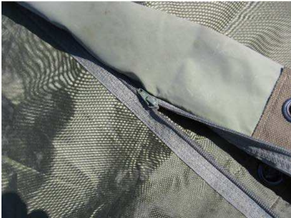
Figure 2 Attacher les tapis de sol

D Cad 3, 2006, Ottawa ON, Ministère de la Défense nationale