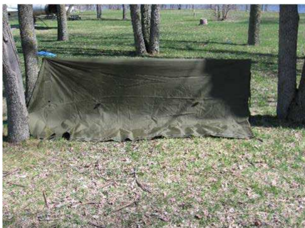
Figure 6 Fixer les tapis de sol

D Cad 3, 2006, Ottawa ON, Ministère de la Défense nationale