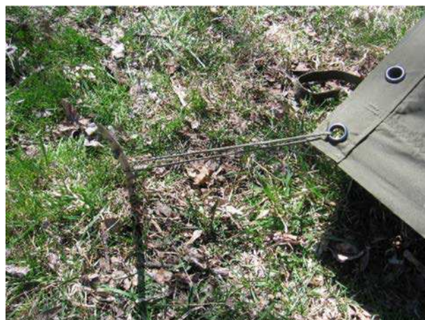
Figure 7 Fixer les œillets avec des piquets

D Cad 3, 2006, Ottawa ON, Ministère de la Défense nationale