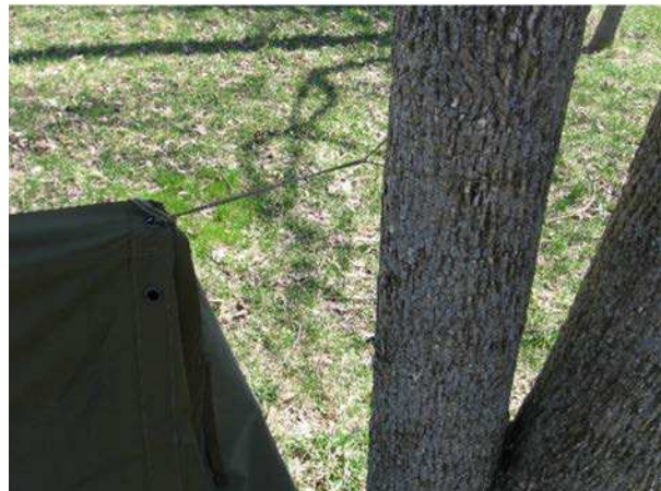
Figure 5 Attacher l'abri à un arbre

D Cad 3, 2006, Ottawa ON, Ministère de la Défense nationale