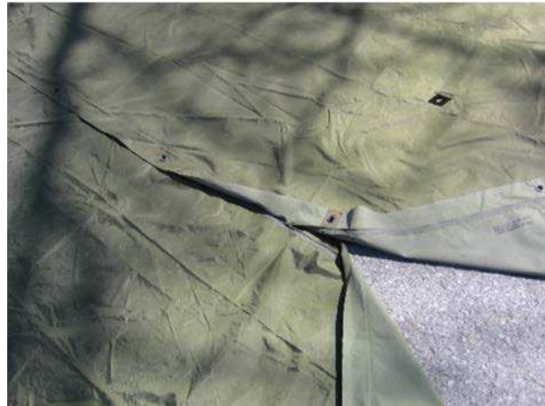
Figure 3 Assembler les tapis de sol

D Cad 3, 2006, Ottawa ON, Ministère de la Défense nationale