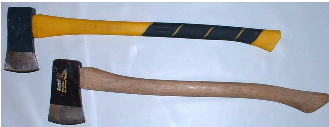
Figure 12 Hache à simple tranchant

La scie à archet est une scie à structure de métal en forme d'arc avec une lame épaisse à grosses dents. Elle est utilisée le plus souvent pour couper des arbres et des branches. La lame est dentelée et suspendue entre deux longs manches étroits appelés « joues ».