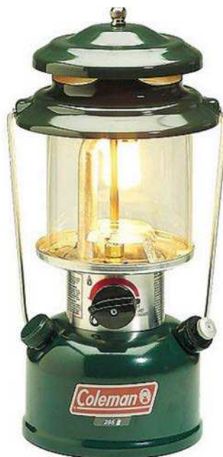
Figure 9 Fanal à un manchon au naphte