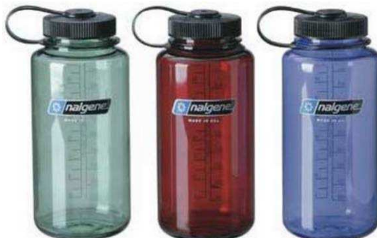
Figure 18 Bouteille d'eau Nalgene

Mountain Equipment Coop. Extrait le 28 mars 2007 du site http://www.mec.ca/Products/product_detail.jsp?PRODUCT%3C%3Eprd_id=845524442500177&FOLDER%3C%3Efolder_id=2534374302696609&bmUID=1177425692300