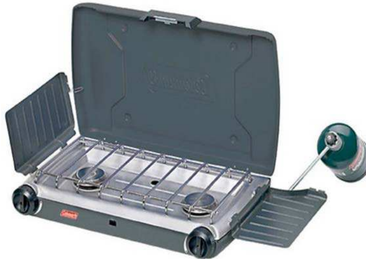
Figure 8 Réchaud Coleman à deux brûleurs au propane