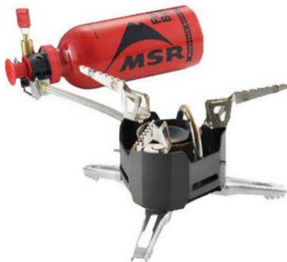
Figure 6 Réchaud à brûleur unique MSR

Mountain Equipment Coop. Extrait le 24 avril 2007 du site http://www.mec.ca/Products/product_detail.jsp?PRODUCT%3C%3Eprd_id=845524441772275&FOLDER%3C%3Efolder_id=2534374302696497&bmUID=1175178016804