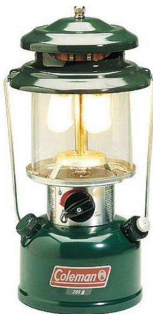
Figure 10 Fanal à deux manchons au naphte