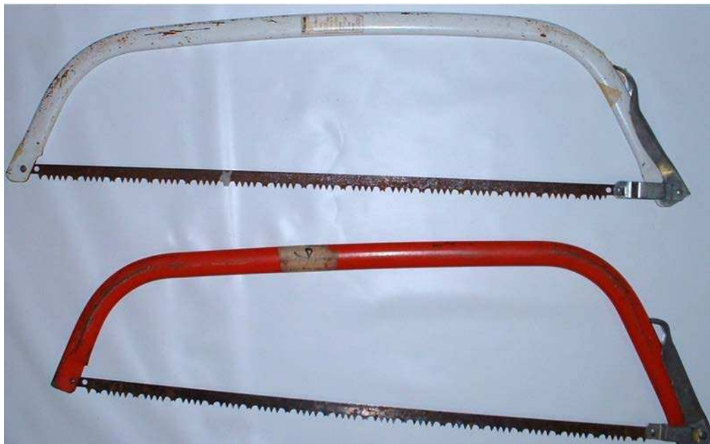
Figure 13 Scie à arc

D Cad 3, 2007, Ottawa, ON, Ministère de la Défense nationale