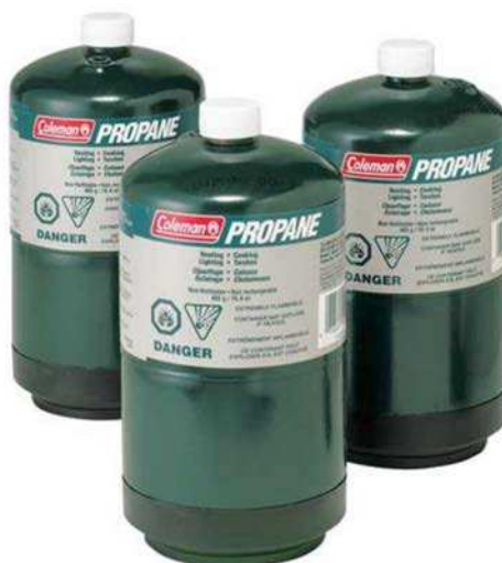
Figure 2 Gaz comprimé

Canadian Tire. Extrait le 24 avril 2007 du site http://www.canadiantire.ca/browse/product_detail.jsp?FOLDER%3C%3Efolder_id=1408474396672290&bmUID=1178201728250&PRODUCT%3C%3Eprd_id=845524443280741&assortment=primary&fromSearch=true