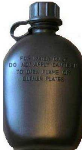
Figure 17 Gourde d'eau

Bouteille d'eau. On peut utiliser une bouteille d'eau pour tout type de randonnée pédestre. L'équipement polyvalent est avantageux pour l'utilisateur. Choisir les bouteilles qui peuvent supporter les températures de liquides froids à congélation ou chauds à ébullition.