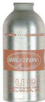
Figure 15 Réciipient de carburant