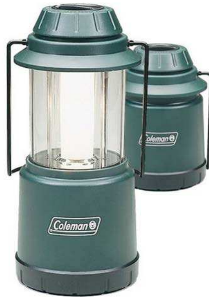
Figure 11 Fanal compact à piles

Coleman Outdoor Company. Extrait le 28 mars 2007 du site http://www.coleman.com/coleman/colemancom/detail.asp?product_id=5315J725&categoryid=1045