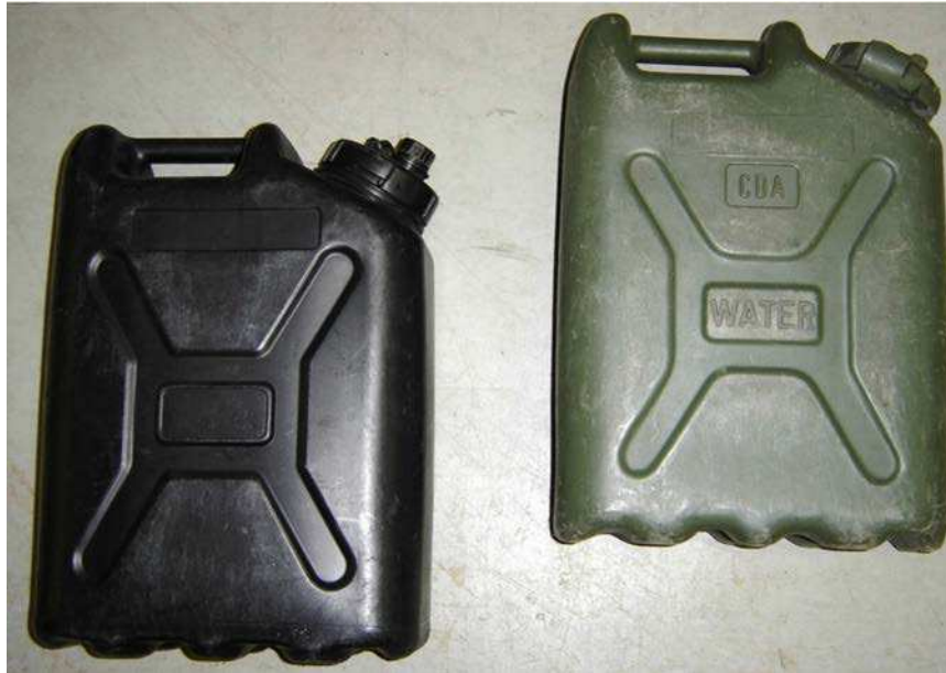
Figure 20 Jerrican (bidon) noir et vert

D Cad 3, 2007, Ottawa, ON, Ministère de la Défense nationale