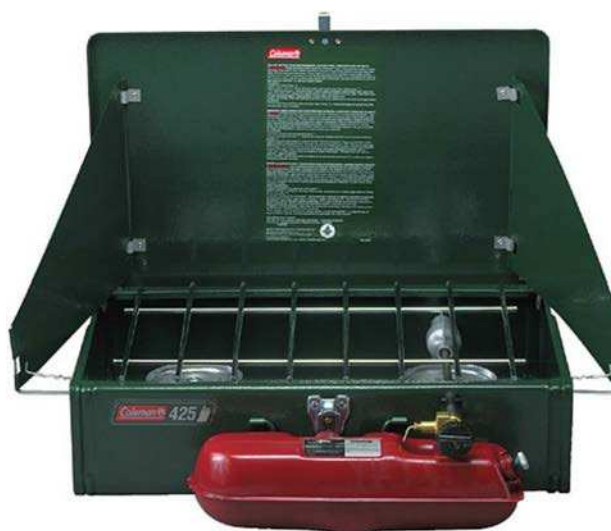
Figure 7 Réchaud Coleman à deux brûleurs au naphte de Powerhouse

Réchaud à deux brûleurs. Le réchaud à deux brûleurs est un article efficace qui est particulièrement approprié en campagne. Lors d'un déplacement en groupe, ce réchaud peut être transporté dans un véhicule d'approvisionnement ou un traîneau. Ce réchaud est muni de deux brûleurs, ce qui aide à accélérer la cuisson.