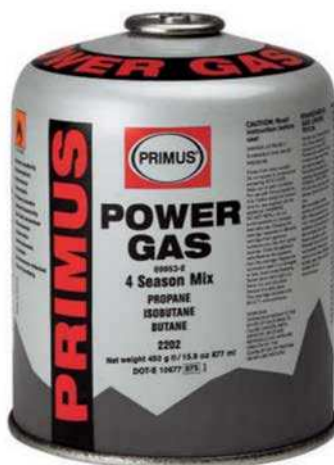
Figure 3 Gaz comprimé

Canadian Tire. Extrait le 24 avril 2007 du site http://www.canadiantire.ca/browse/product_detail.jsp?FOLDER%3C%3Efolder_id=1408474396672290&bmUID=1178201728250&PRODUCT%3C%3Eprd_id=845524443280741&assortment=primary&fromSearch=true