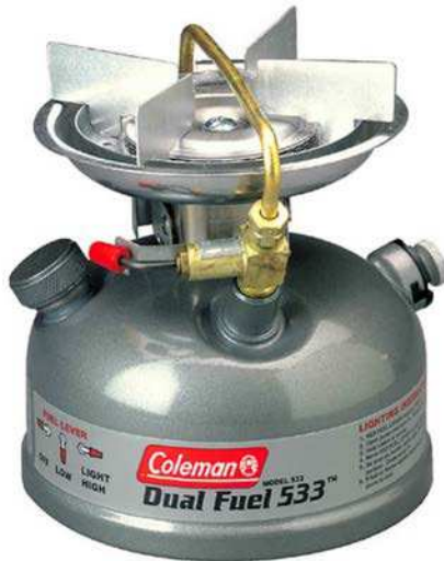
Figure 5 Réchaud à brûleur unique Coleman

Réchaud unique. Les réchauds à brûleur unique sont portatifs, ce qui permet de faire la cuisson n'importe où sans avoir à faire un feu. Ces réchauds s'entreposent bien et peuvent être portés facilement lors d'une randonnée. Le carburant est transporté dans un récipient séparé pour s'assurer qu'il n'y a pas de déversement de carburant dans le sac à dos.