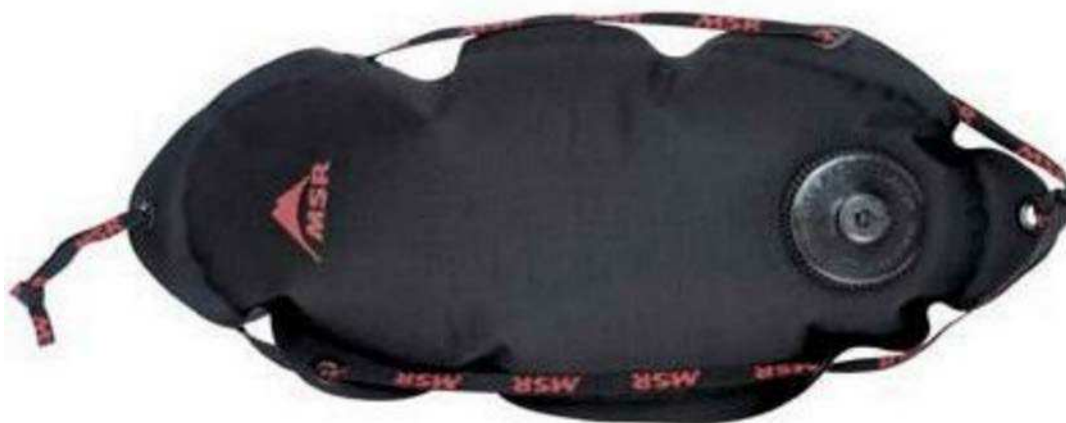
Figure 19 Sac d'eau MSR

Sac gourde. Les sacs transporteurs gourdes sont pratiques pour de longues randonnées où il n'y a pas d'eau et pour transporter l'eau d'une source au campement. Les petits sacs sont utiles car ils peuvent être équilibrés sur différentes parties d'un sac à dos. Les sacs gourdes peuvent contenir jusqu'à plusieurs litres d'eau.