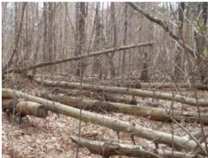
« Colby-Sawyer College », Kelsy Forest Walk