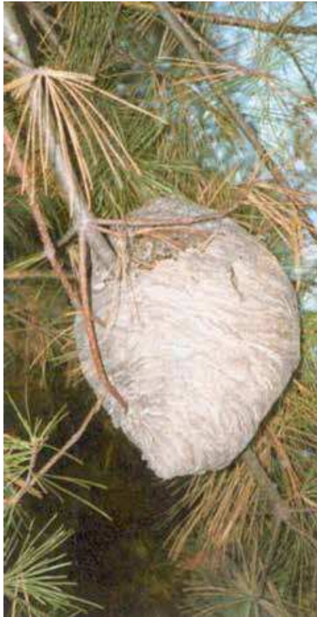
P. Tawrell, Camping and Wilderness Survival, Paul Tawrell (page 898)