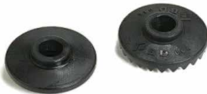
Figure 16-4-11 Rondelles en forme de flocon de neige

Backcountrygear.com, 2007, Black Diamond Trekking Pole Spare Baskets. Extrait le 17 avril 2007 du site http://www.backcountrygear.com/catalog/accessdetail.cfm/BD320