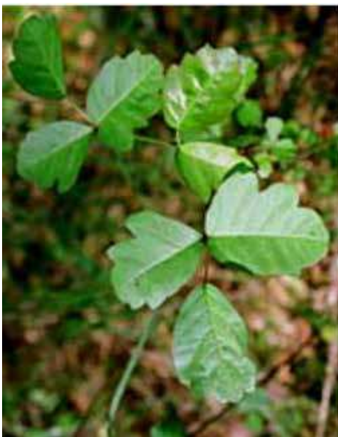
The Coloma Valley: Where the Gold Rush Began: Coloma Valley Nature Reference. Extrait le 18 mars 2008 du site www.coloma.com/reference/401-1-18-poisonoak.jpg