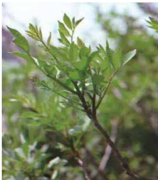
Figure 12-3-6 Sumac vénéneux

Agriculture et Agroalimentaire Canada. Extrait le 18 mars 2008 du site http://res2.agr.gc.ca/ecorc/poison/vernix_e.htm